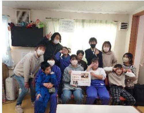
<高村さんお別れ会>